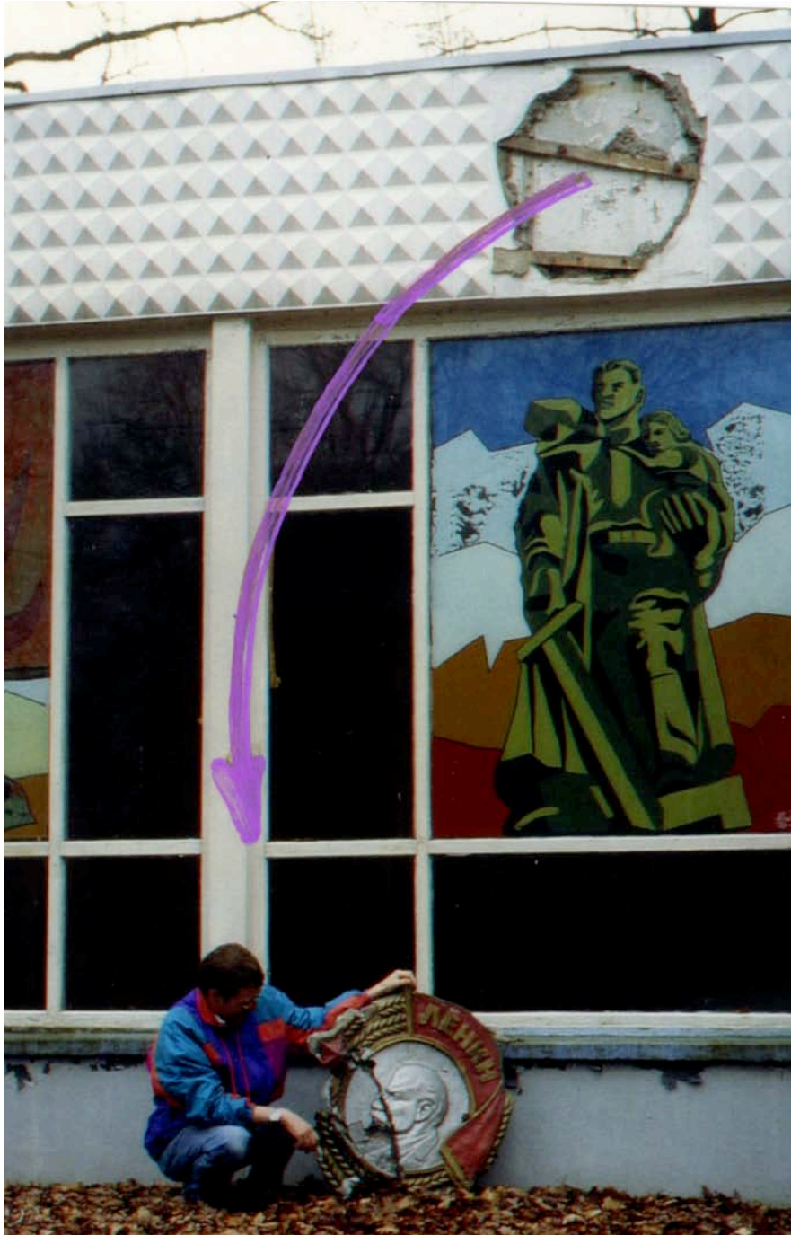
Nach dem Abzug der Sowjets, am Museum der 8. Gardearmee.

Das Verhältnis von Bevölkerung und Sowjetarmee in Nohra bei Weimar