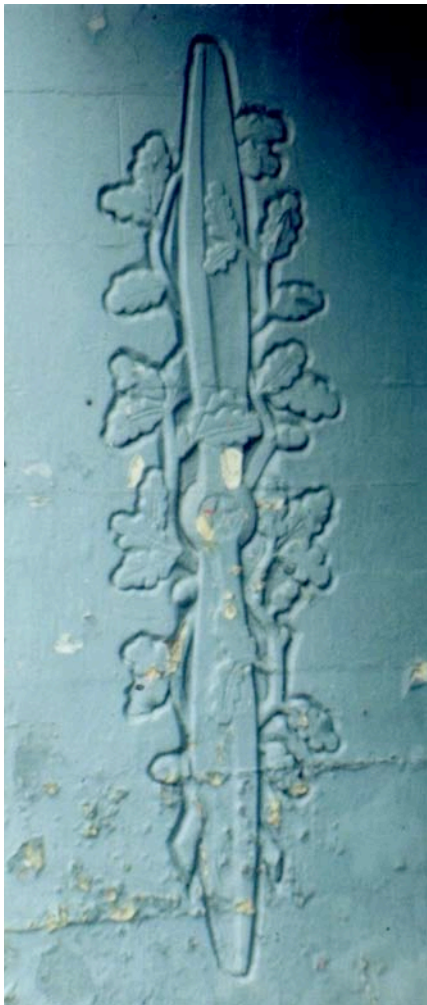
Propeller im Eichenkranz an der ehemaligen Tür der NS-Fliegertransportabteilung. In sowjetischen Zeiten mit fünfeckigem Stern versehen. Foto: Gerhard Henschel 9/2005

als 20 Offiziersvillen, knapp 200 ha Flugplatz und ca. 1000 ha „illegal genutzte Fläche im Landkreis“. 2 In Nohra gab es keine Bauern, die mehr als 100 ha Land besaßen, so dass bei der Landaufteilung anfangs auch ehemaliges Militärgelände genutzt wurde. Dies wurde jedoch bald rückgängig gemacht. Die Nazigebäude wurden umgewidmet. Im ehemaligen Gauforum zu Weimar wurde eine goldene Stalinstatue errichtet, und im Zentrum des Nohraer Fliegerhorstes wurde später ein Lenindenkmal aufgestellt.